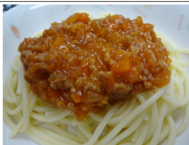
小麦粉でトロミをつけているので焦げないように弱火でかきまぜながらじっくり煮込みます。