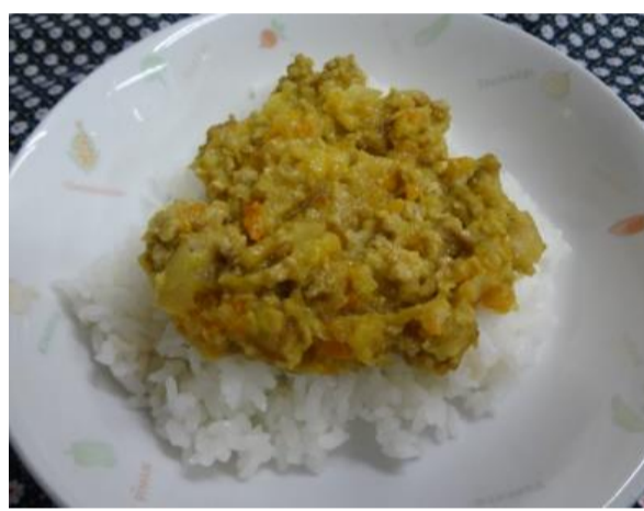
カレー粉が控えめなので乳児の子どもたちにも人気のドライカレー