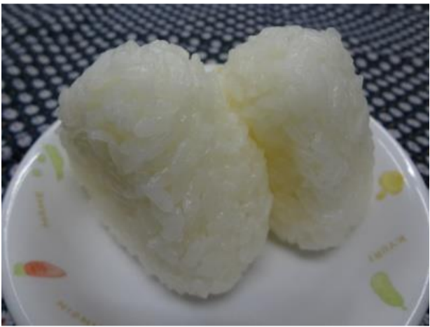
お米はこしひかり。ガス釜で炊いたご飯を、じっくり煮つめた平釜塩でにぎったおにぎり

毎年、卒園するらいおんさん（5歳児）一人ひとりのリクエストメニューが2月と3月の献立に登場します！お昼ご飯やおやつで食べたいものを一つだけリクエストできます。なかなか一つに決められなかったり、去年のらいおんさんがリクエストしたメニューを覚えていて同じ物をリクエストする子もいます。らいおんさんになったら何リクエストしようかな？と1年後を楽しみにしている子もいます。らいおんさんの『これが食べたい！』という願いが叶う日。1人ひとりの願いを大切に作りました。