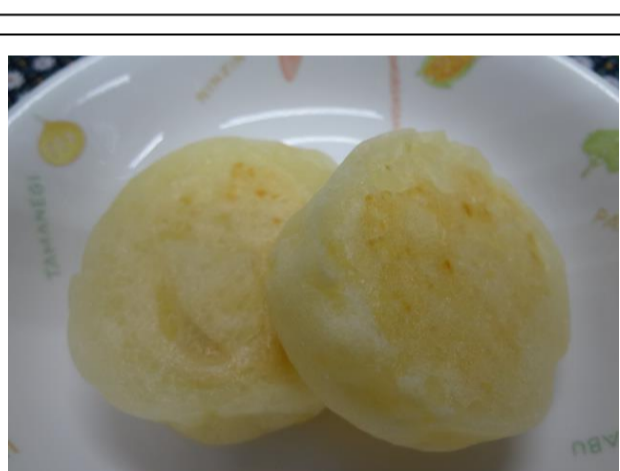
つぶしたじゃが芋にバターと塩、片栗粉を混ぜ焼いた優しい味のじゃが芋もち