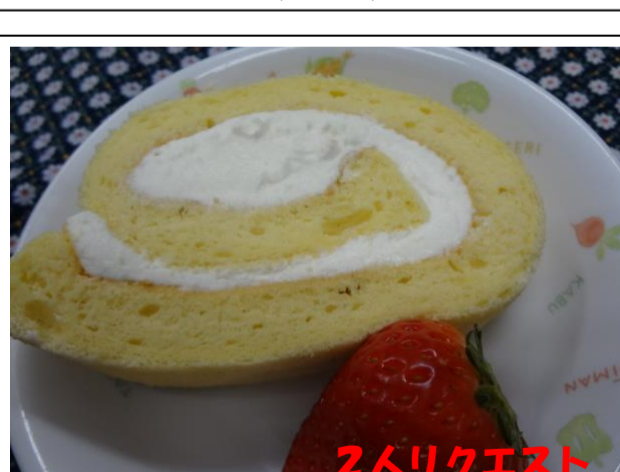
甘さ控えめな生クリームをシフォンケーキの生地ですきまを埋めた手作りのロールケーキ