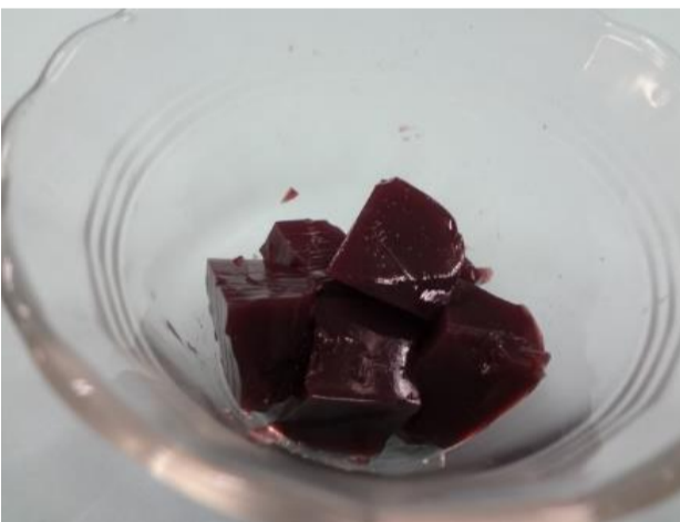
ストレート果汁のぶどうジュースをゼラチンでかためた砂糖未使用のぶどうゼリー