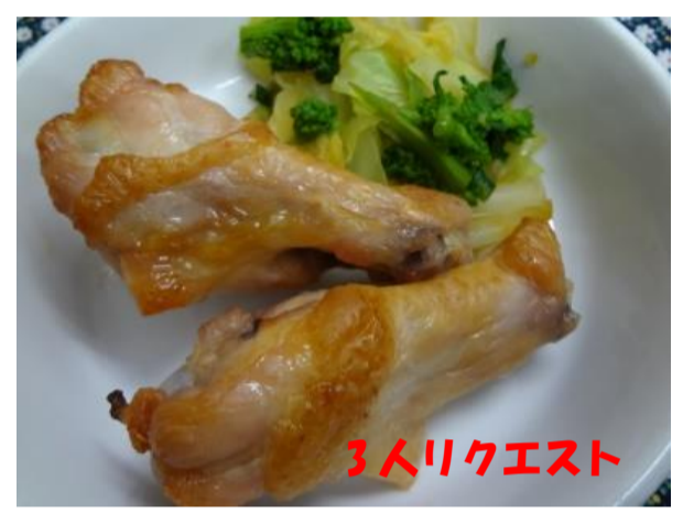
お酒をまぶした後に、塩をすりこみごま油をからめオープンで焼いたらできあがり。